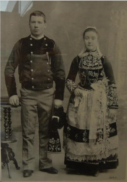
Photo de votre reconstitution