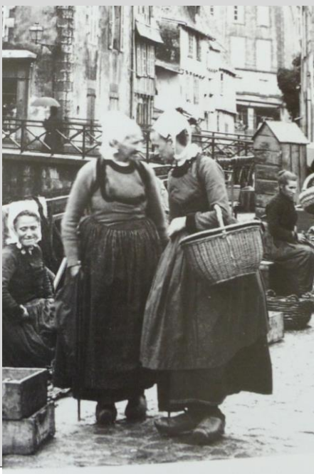
Photo de votre reconstitution