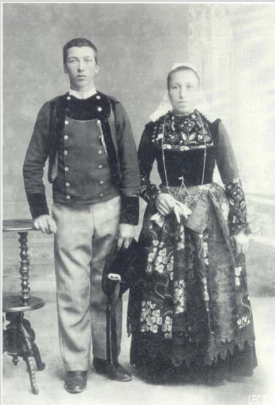
Photo de votre reconstitution