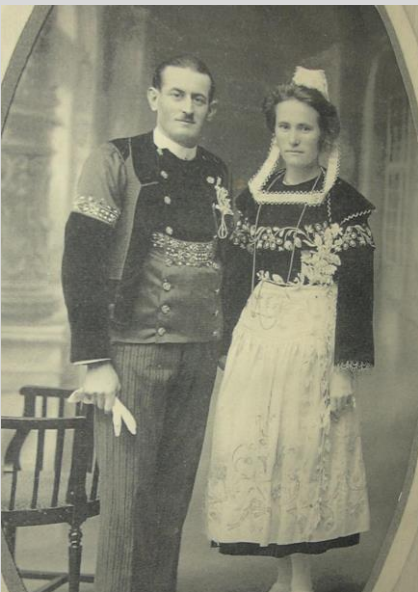
Photo de votre reconstitution