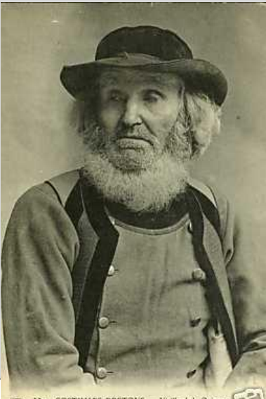
Photo de votre reconstitution