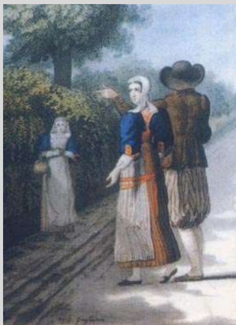
Photo de votre reconstitution