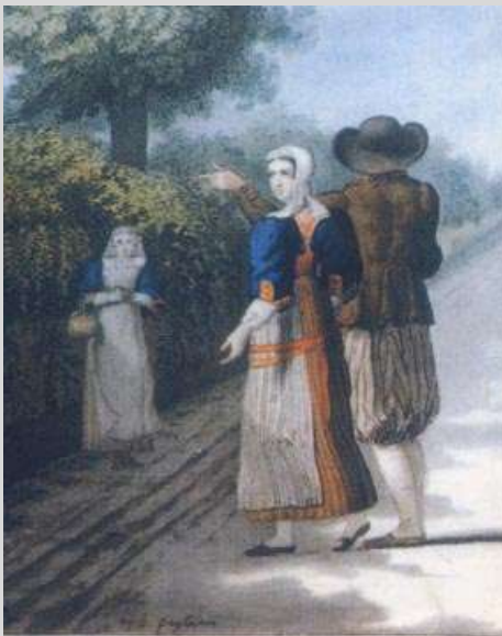
Photo de votre reconstitution