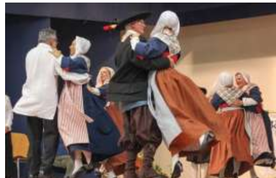
Extrait du spectacle 2013