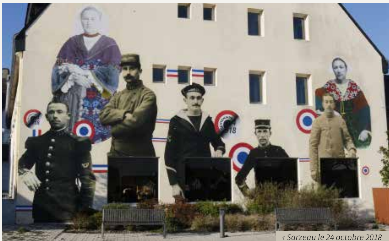
< Sarzeau le 24 octobre 2018