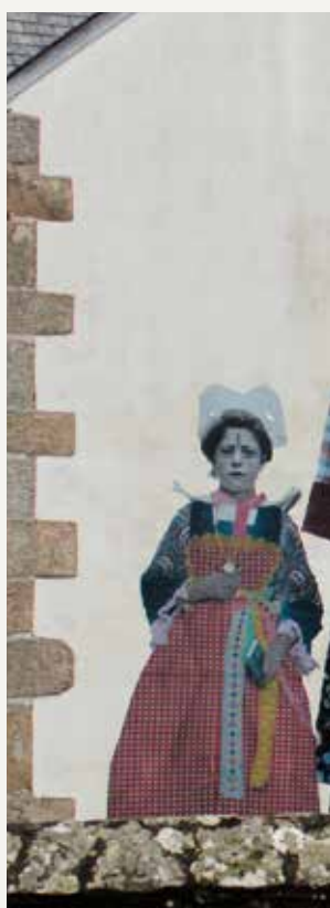
Riec-sur-Bélon, décembre 2017 >